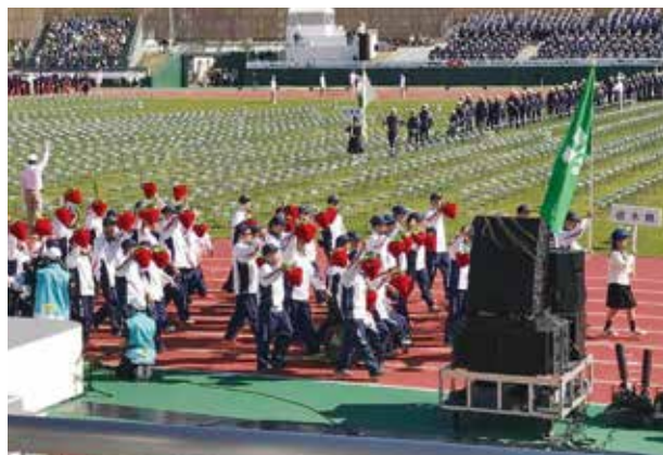
入場行進 (9.98スタジアム)