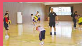
(宇都宮青葉高等学園)