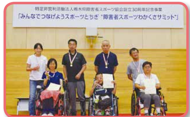
正式競技の部 入賞チーム