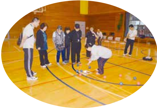
鹿沼市：TKC いちごアリーナ（ボッチャ）