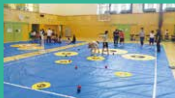
(コントロール・アタックをしている写真)

7月22日(日)第1回わかくさアリーナ講座 ・種目:コントロール・アタック/ポッチャ ・参加者:障害者:11名 保護者:11名、合計22名