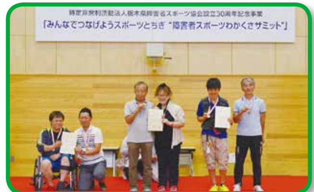
オープン競技の部 入賞チーム