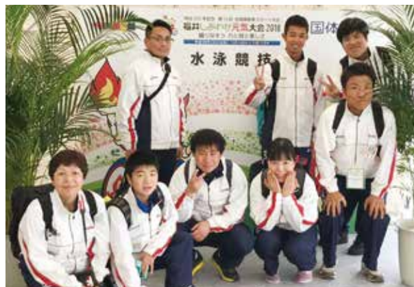
水泳競技選手団 (敦賀市総合運動公園プール)