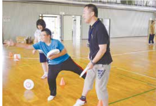
那須烏山市：烏山体育館（フライングディスク）