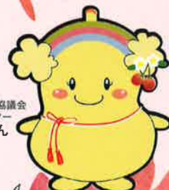
栃木県老人福祉施設協議会 イメージキャラクター とちふくちゃん