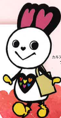
カルフルとちぎ応援隊長 ナイチュウ